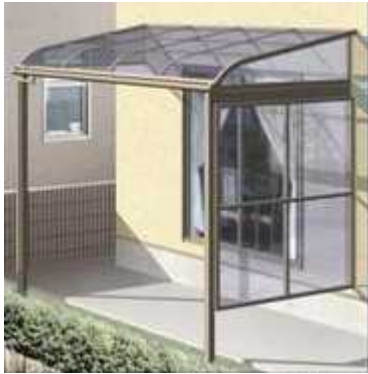
屋根材 R タイプ

風雨が入りにくしたり、通行人の目から部屋の中や洗濯物を目隠ししたりできます。取付位置が自由となり、自在桁仕様も取付可能になりました